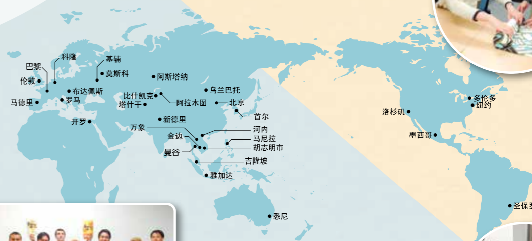
JF讲座开设地区（截至2014年4月共28国31个讲座）